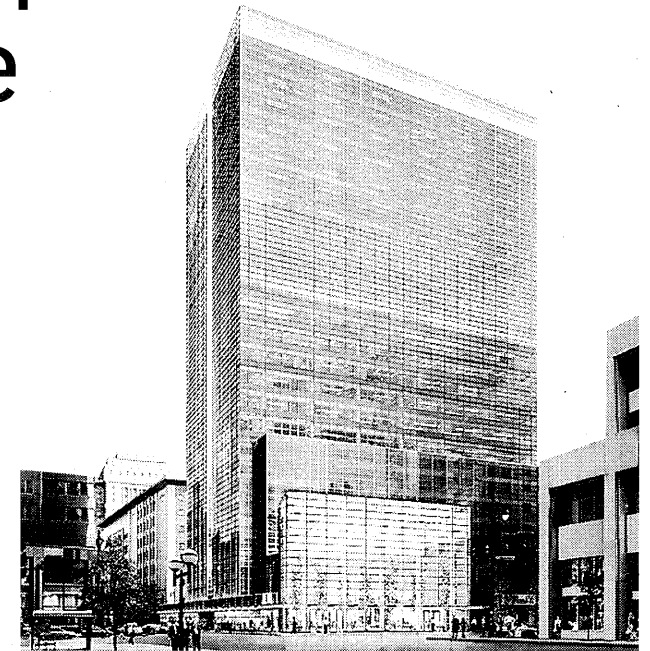
L'immeuble du 900, De Maisonneuve Ouest, compterait 28 étages et une superficie de 37 000 mètres carrés.

Les autres projets de tours de bureaux dans le centre-ville de Montréal sont eux aussi bloqués depuis des mois, voire des années. Les promoteurs attendent qu'un locataire majeur se manifeste avant de mettre leurs projets en chantier.